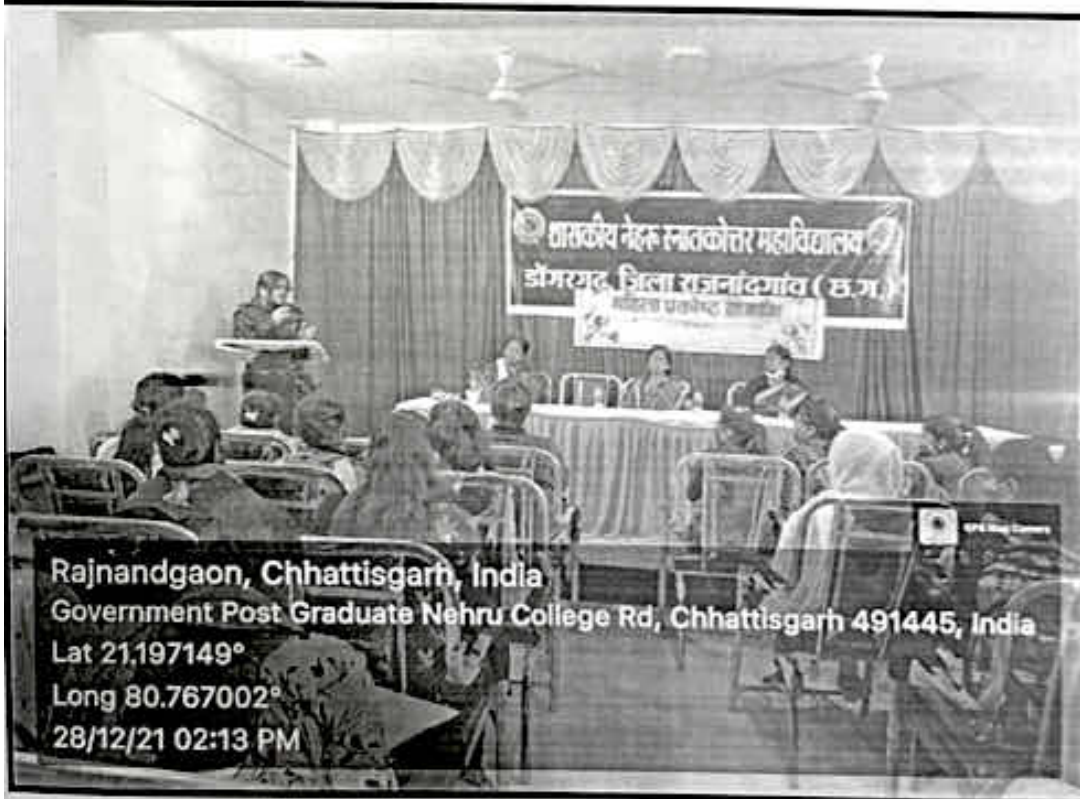
Rajnandgaon, Chhattisgarh, India Government Post Graduate Nehru College Rd, Chhattisgarh 491445, India Lat 21.197149° Long 80.767002° 28/12/21 02:13 PM