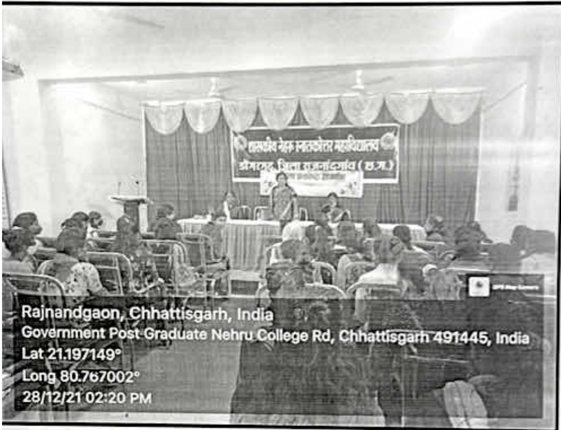
Rajnandgaon, Chhattisgarh, India Government Post Graduate Nehru College Rd, Chhattisgarh 491445, India Lat 21.197149° Long 80.767002° 28/12/21 02:20 PM