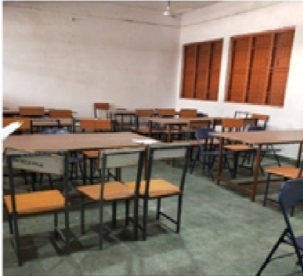
Government Post Graduate Nehru College Rd, Chhattisgarh 491445, India

Latitude Longitude 21.19711645° 80.76713063° Local 03:35:28 PM Altitude 286.79 meters GMT 10:05:28 AM Saturday, 04-03-2021