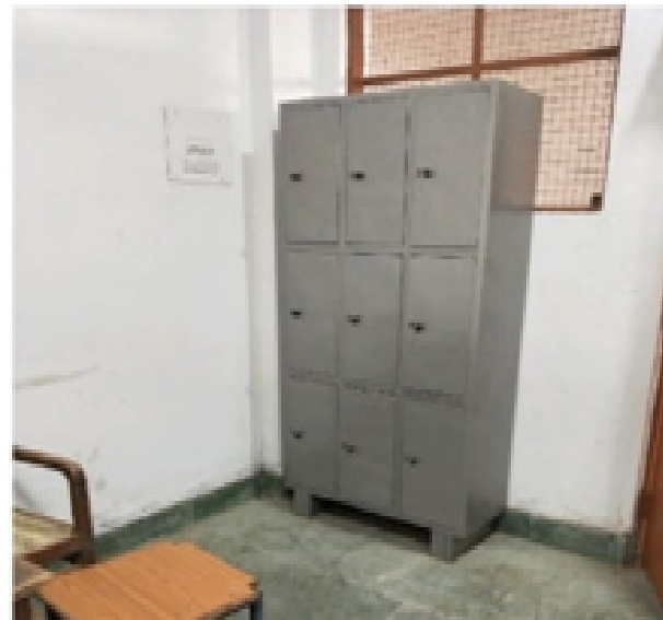
Government Post Graduate Nehru College Rd, Chhattisgarh 491445, India

Latitude Longitude 21.19702026° 80.76699329° Local 03:40:01 PM Altitude 299.02 meters GMT 10:10:01 AM Saturday, 04-03-2021