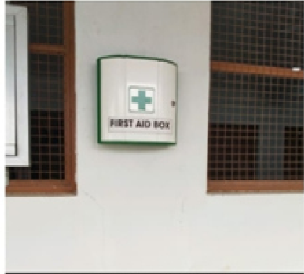
Government Post Graduate Nehru College Rd, Chhattisgarh 491445, India

Latitude Longitude 21.19711645° 80.76713063° Local 03:35:28 PM Altitude 286.79 meters GMT 10:05:28 AM Saturday, 04-03-2021