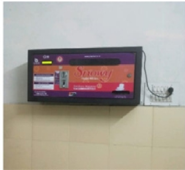
Government Post Graduate Nehru College Rd, Chhattisgarh 491445, India

Latitude Longitude 21.19714606° 80.76719671° Local 03:35:12 PM Altitude 282.28 meters GMT 10:05:12 AM Saturday, 04-03-2021