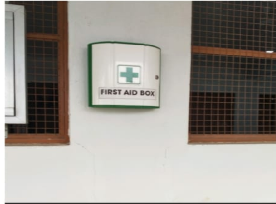
Government Post Graduate Nehru College Rd, Chhattisgarh 491445, India

Latitude Longitude 21.19711645° 80.76713063° Local 03:35:28 PM Altitude 286.79 meters GMT 10:05:28 AM Saturday, 04-03-2021