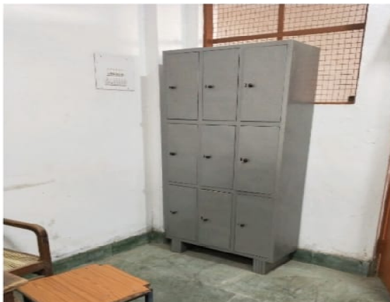
Government Post Graduate Nehru College Rd, Chhattisgarh 491445, India

Latitude Longitude 21.19702026° 80.76699329° Local 03:40:01 PM Altitude 299.02 meters GMT 10:10:01 AM Saturday, 04-03-2021