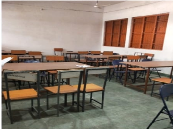
Government Post Graduate Nehru College Rd, Chhattisgarh 491445, India

Latitude Longitude 21.19711645° 80.76713063° Local 03:35:28 PM Altitude 286.79 meters GMT 10:05:28 AM Saturday, 04-03-2021