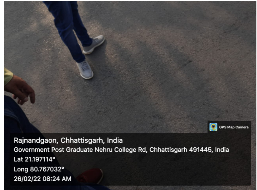
Rajnandgaon, Chhattisgarh, India Government Post Graduate Nehru College Rd, Chhattisgarh 491445, India Lat 21.197114° Long 80.767032° 26/02/22 08:24 AM