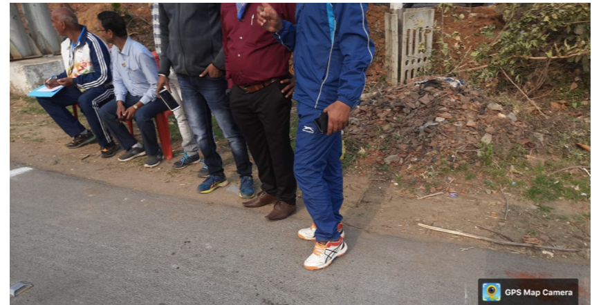
Rajnandgaon, Chhattisgarh, India Government Post Graduate Nehru College Rd, Chhattisgarh 491445, India Lat 21.197114° Long 80.767032° 26/02/22 08:25 AM