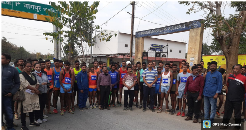
Rajnandgaon, Chhattisgarh, India Government Post Graduate Nehru College Rd, Chhattisgarh 491445, India Lat 21.197114° Long 80.767032° 26/02/22 07:44 AM