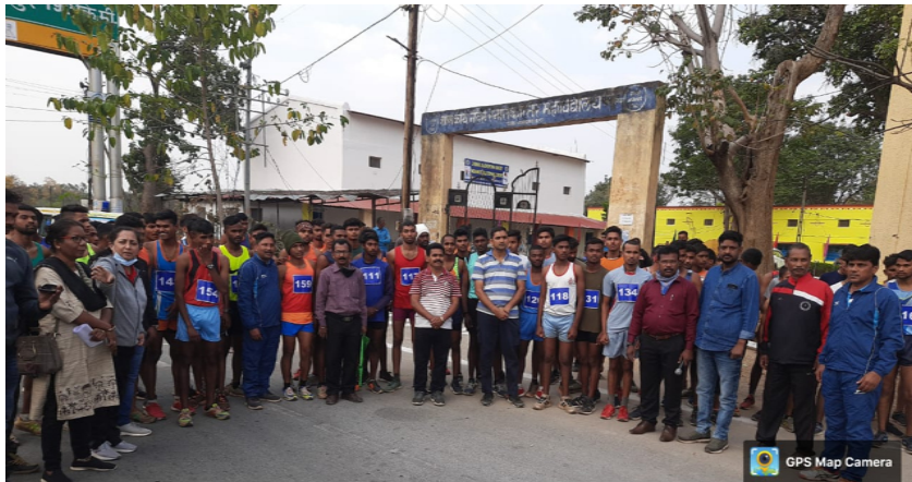
Rajnandgaon, Chhattisgarh, India Government Post Graduate Nehru College Rd, Chhattisgarh 491445, India Lat 21.197114° Long 80.767032° 26/02/22 07:44 AM