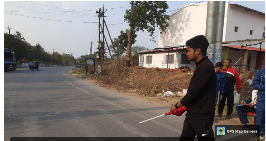
Rajnandgaon, Chhattisgarh, India Government Post Graduate Nehru College Rd, Chhattisgarh 491445, India Lat 21.197114° Long 80.767032° 26/02/22 08:26 AM