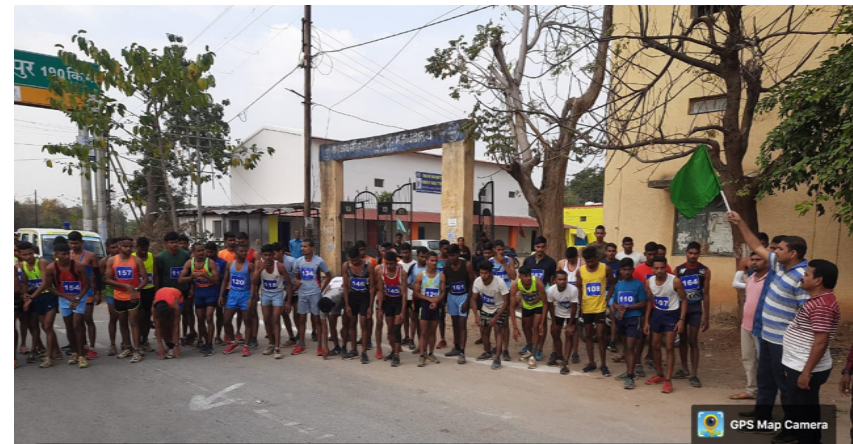
Rajnandgaon, Chhattisgarh, India Government Post Graduate Nehru College Rd, Chhattisgarh 491445, India Lat 21.197114° Long 80.767032° 26/02/22 07:51 AM