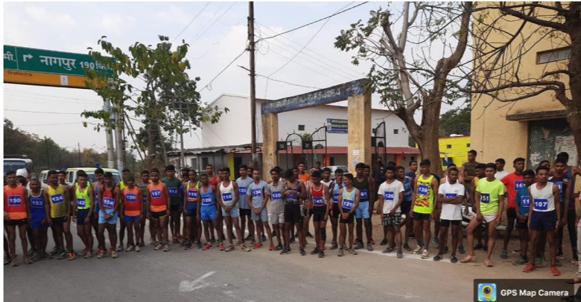
Rajnandgaon, Chhattisgarh, India Government Post Graduate Nehru College Rd, Chhattisgarh 491445, India Lat 21.197114° Long 80.767032° 26/02/22 07:50 AM