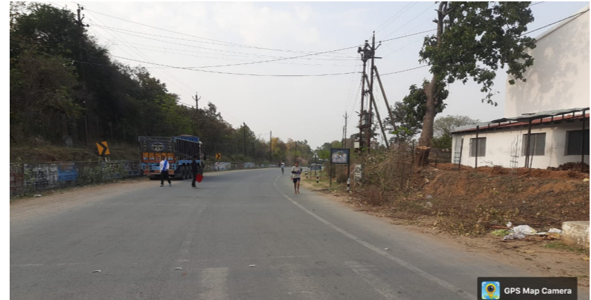
Rajnandgaon, Chhattisgarh, India Government Post Graduate Nehru College Rd, Chhattisgarh 491445, India Lat 21.197114° Long 80.767032° 26/02/22 08:30 AM