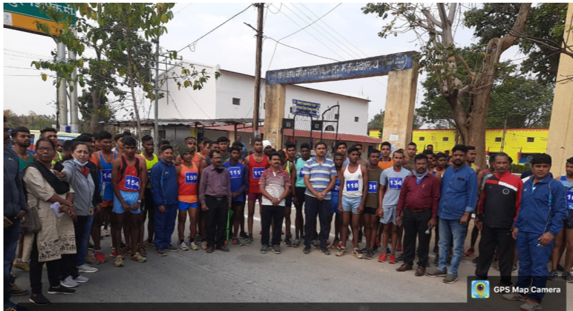
Rajnandgaon, Chhattisgarh, India Government Post Graduate Nehru College Rd, Chhattisgarh 491445, India Lat 21.197114° Long 80.767032° 26/02/22 07:44 AM