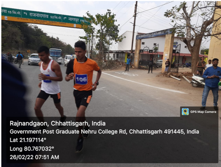
Rajnandgaon, Chhattisgarh, India Government Post Graduate Nehru College Rd, Chhattisgarh 491445, India Lat 21.197114° Long 80.767032° 26/02/22 07:51 AM