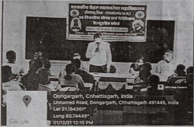
Dongargarh, Chhattisgarh, India Unnamed Road, Dongargarh, Chhattisgarh 491445, India Lat: 21.184351° Long: 80.74425° 12/11/21 12:45 PM