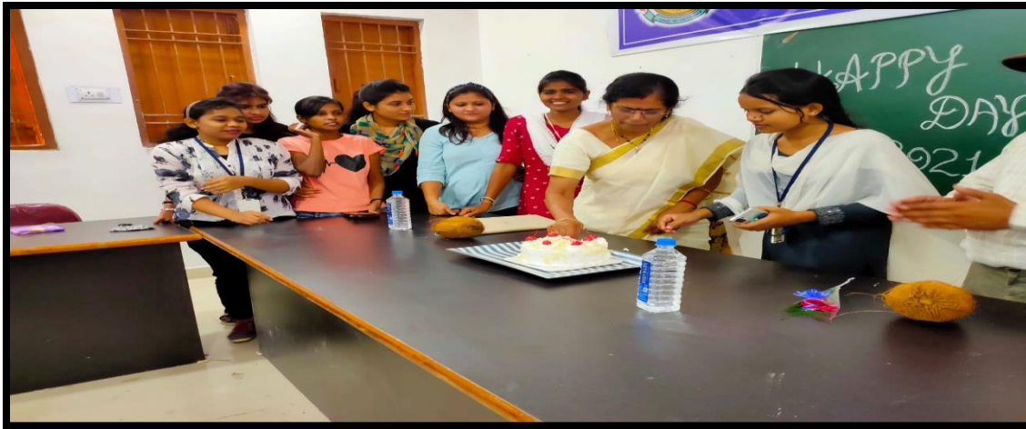
Kargil vijay diwas – 26 July