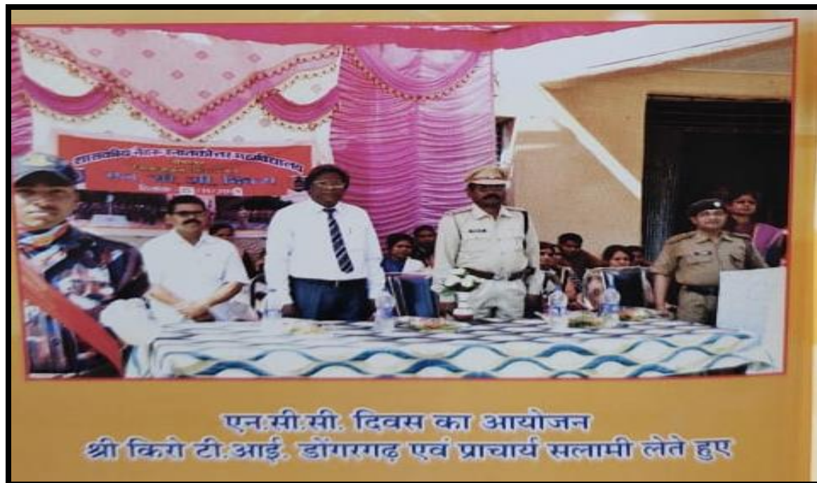
एन.सी.सी. दिवस का आयोजन श्री किरो टी.आई. डॉंगरगढ़ एवं प्राचार्य सलामी लेते हुए